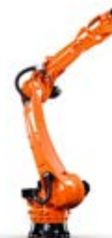
KR IONTEC ULTRA