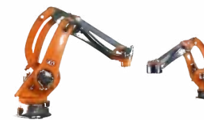
KR 40 PA