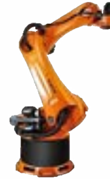
KR 470-2 PA