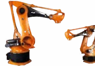
KR 700 PA