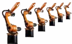
KR CYBERTECH nano