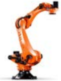
KR FORTEC PA