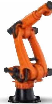
KR FORTEC ULTRA