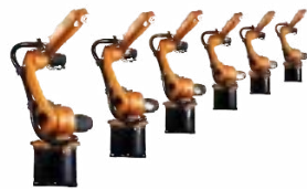
KR CYBERTECH ARC nano