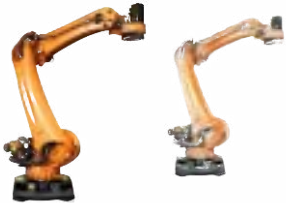
KR QUANTEC PA