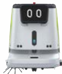
PUDU CC1 Pro