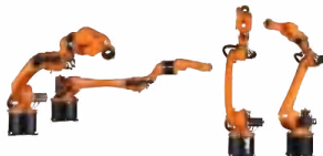
KR CYBERTECH ARC