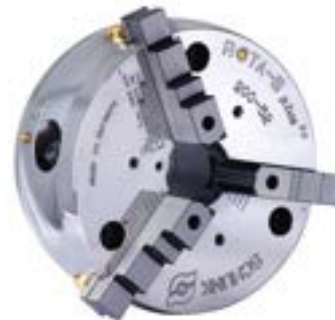
Mandril de Torno