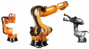
KR QUANTEC nano